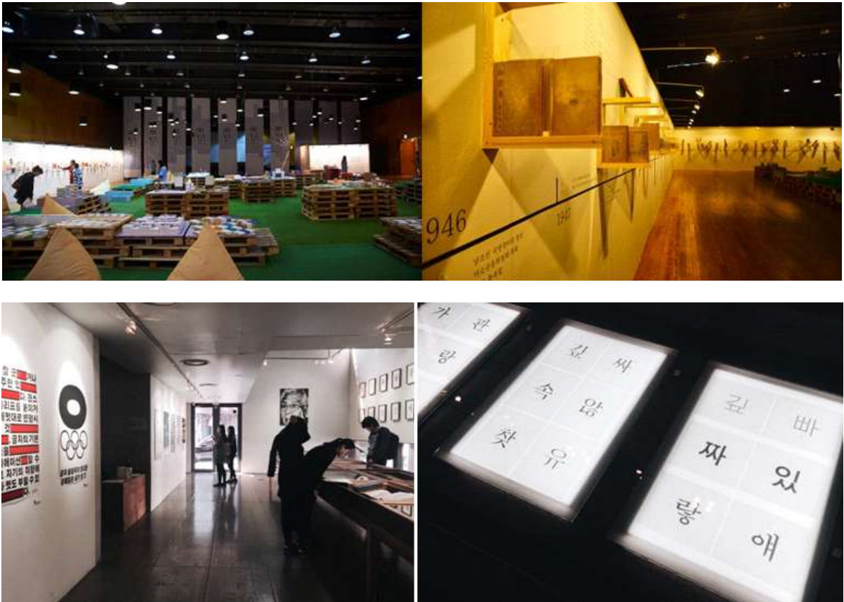
사진 설명 : 테마전시장(위)과 최정호전(아래) 풍경