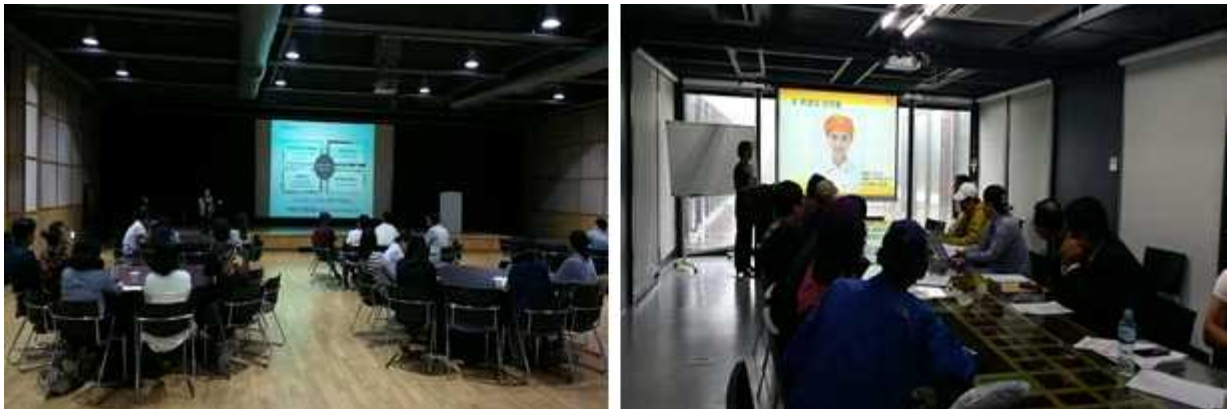
참여자 대상 설명회(左)와 푸드트럭 참가자 대상 위생교육(右) 진행 사진