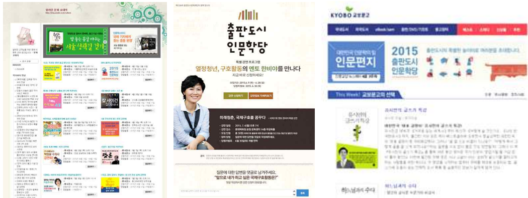
온라인 서점 광고 및 이벤트 : YES24 이벤트(좌), 알라딘 배너 광고(가운데), 교보문고 메일링(우)