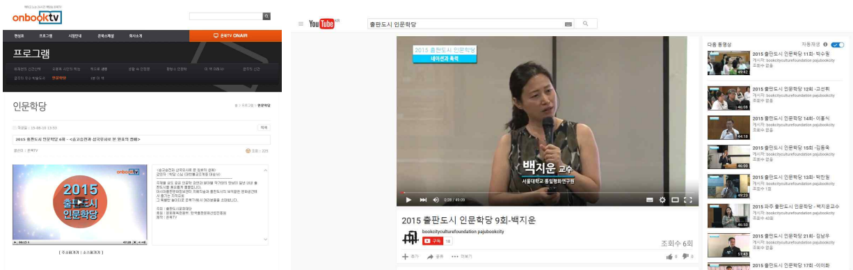
인터넷방송과 케이블방송(KT), 유튜브에서 방송된 출판도시 인문학당 강연