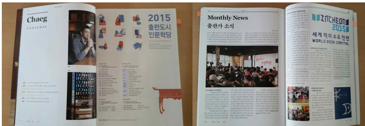
매거진 책 광고 게재 면(좌), 기획기사면(우)