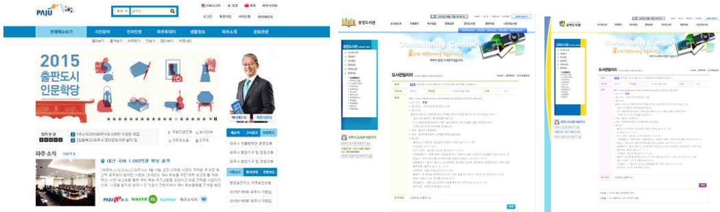
파주시청 및 파주시 관내 도서관 홈페이지 홍보