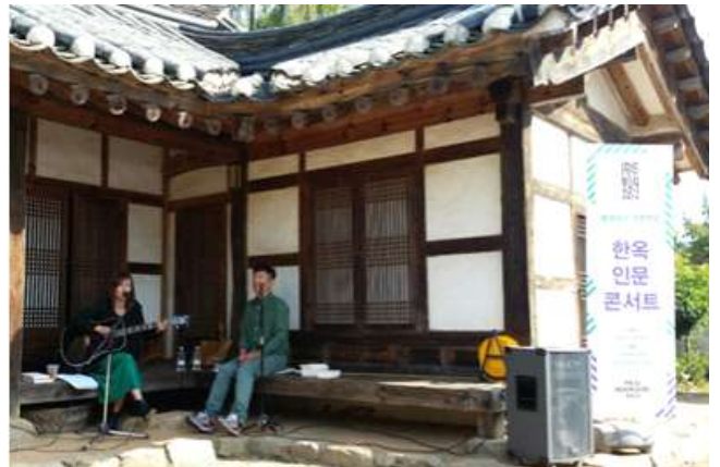
어린이책잔치 특별강연인 어린이음악당(좌)과 북소리 특별강연인 한옥인문 콘서트 강연(우) 모습