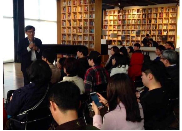
토요 정례 심층 강좌인 토요일엔 인문학(좌)과 책방거리 지원사업 강좌(우) 모습