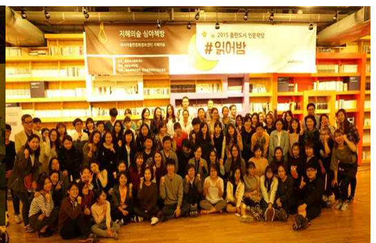
기타 특별강연 프로그램인 브런치특강(좌)과 그림책빛그림이야기(가운데), 심야책방(우) 강연 모습