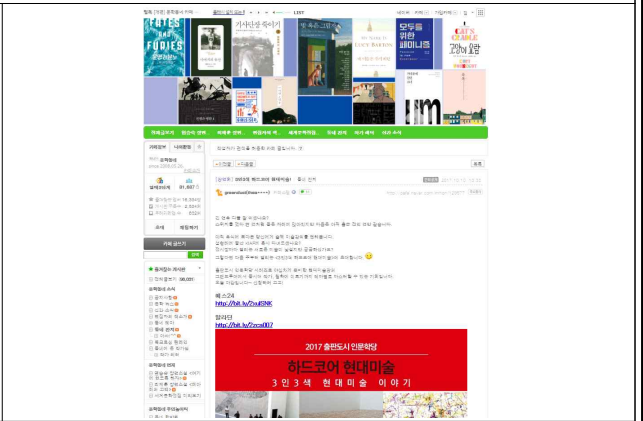
파주시청(좌) 및 출판사 문학동네 커뮤니티(우) 홍보