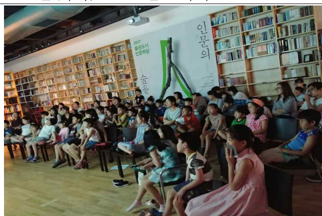
특별 강연 모습 : 서머스쿨(좌), 그림책빛그림이야기(우)