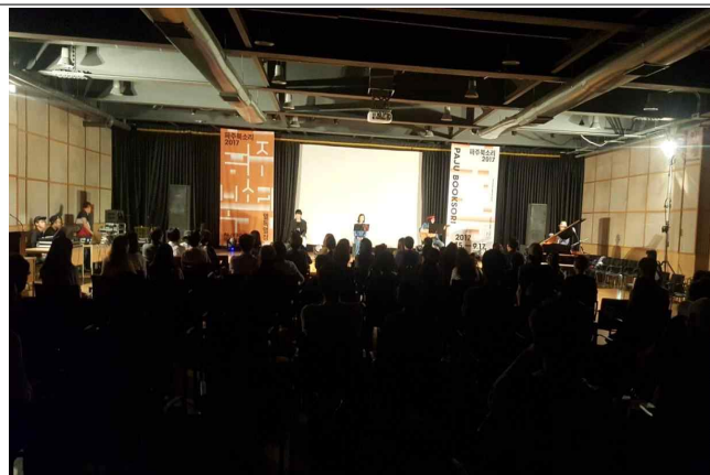
축제연계 강연 모습 : 어린이음악당(좌), 파주북소리 독무대(우)