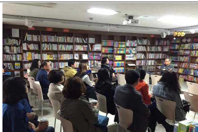
책방거리 지원사업 강좌 모습 : 부산 우리글방(좌), 군산 한길문고(우)