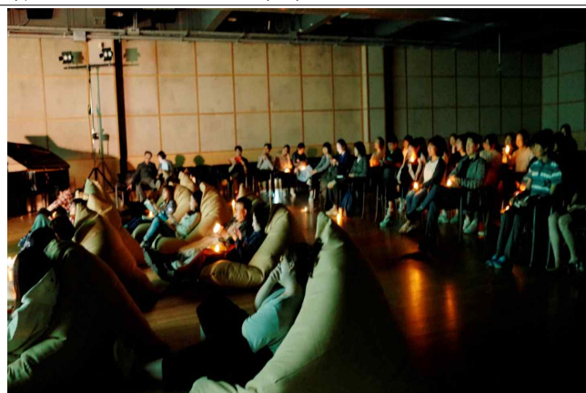
특별 강연 모습 : 북유럽아트(좌), 심야책방(우)