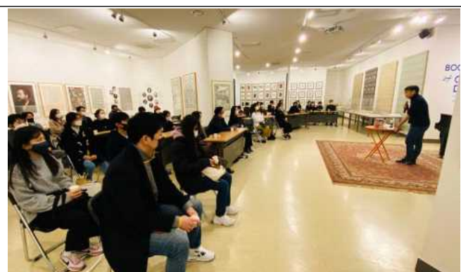
출판도시 인문학당 상/하반기 지원사업 강좌 모습 : 명필름(좌), 한길사(우)