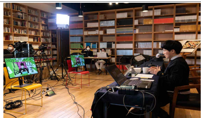
특별 강연 모습 : 연말강연-2020 마음 연말정산(좌), 연말강연-2021 도약! 프로젝트(우)