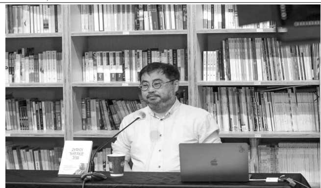
특별 강연 모습 : 문발살롱(좌),(우)