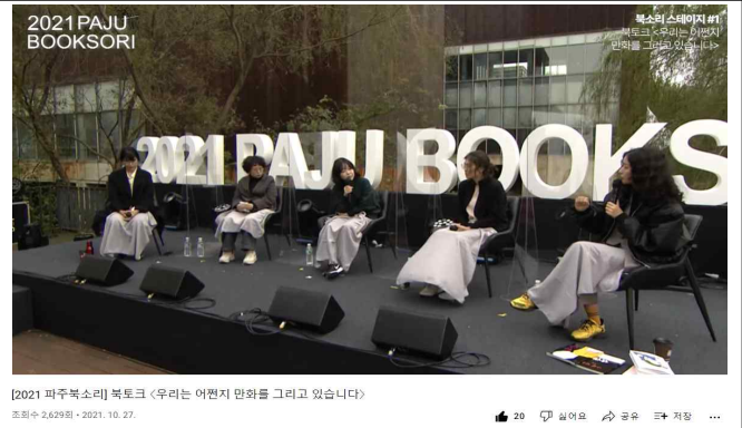
축제연계 강연 모습 : 문발스태이지(좌), 북소리스태이지(우)