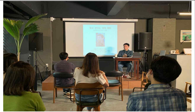
출판도시 인문학당 상/하반기 지원사업 강좌 모습 : 명필름(좌), 한길사(우)