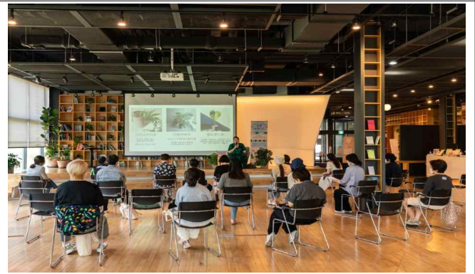
특별 강연 모습 : 문발포엣살롱(좌), 문발포레스트살롱(우)